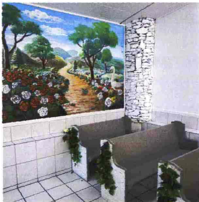
LAS VEGAS. NELLA CITTÀ DEI MATRIMONI MORDI E FUGGI NON POTEVA MANCARE LA CAPPELLA «DRIVE THRU» PER SPOSARSI SENZA SCENDERE DALLA MACCHINA. 9 OTTOBRE